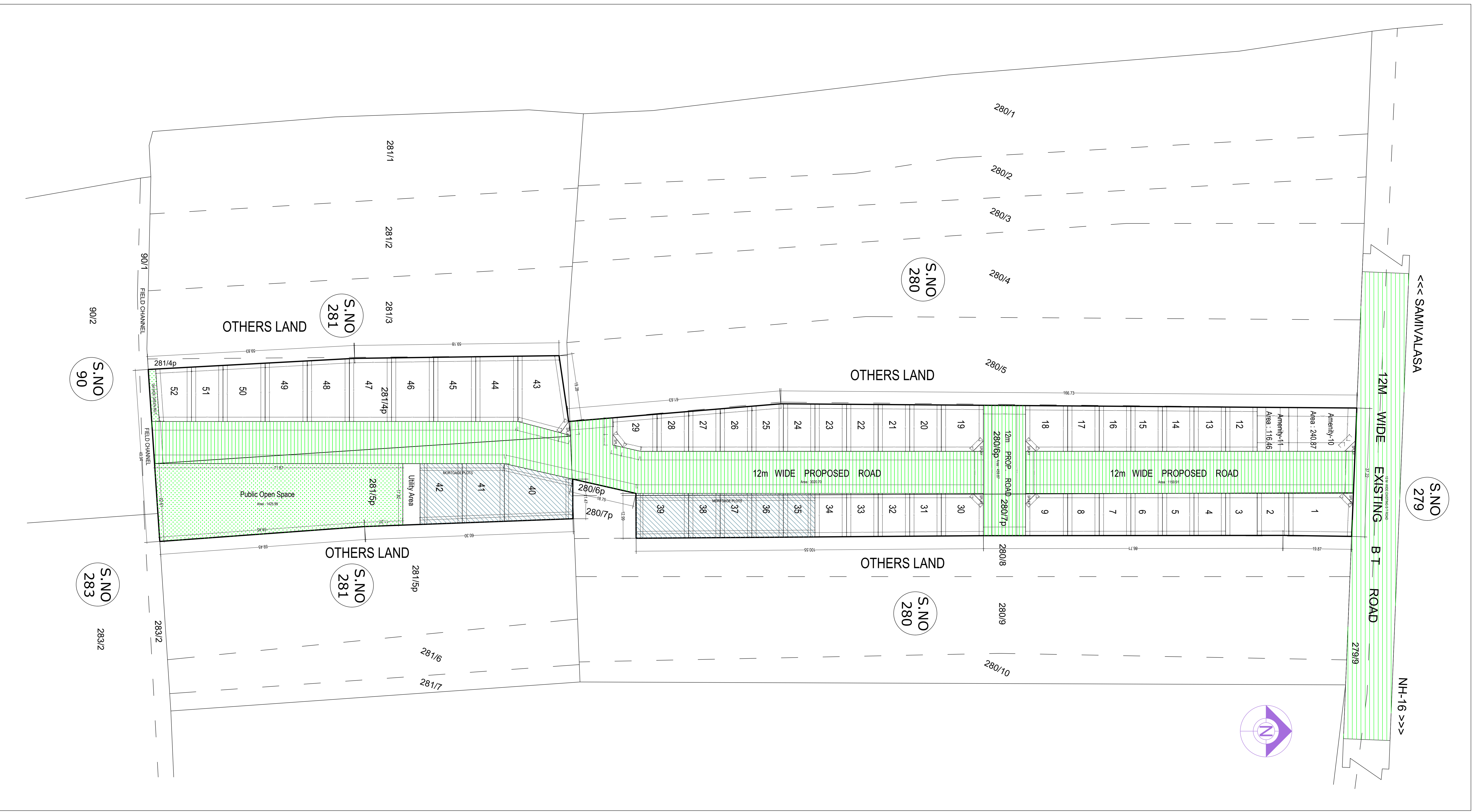
LAYOUT PLAN (Scale - 1:400)