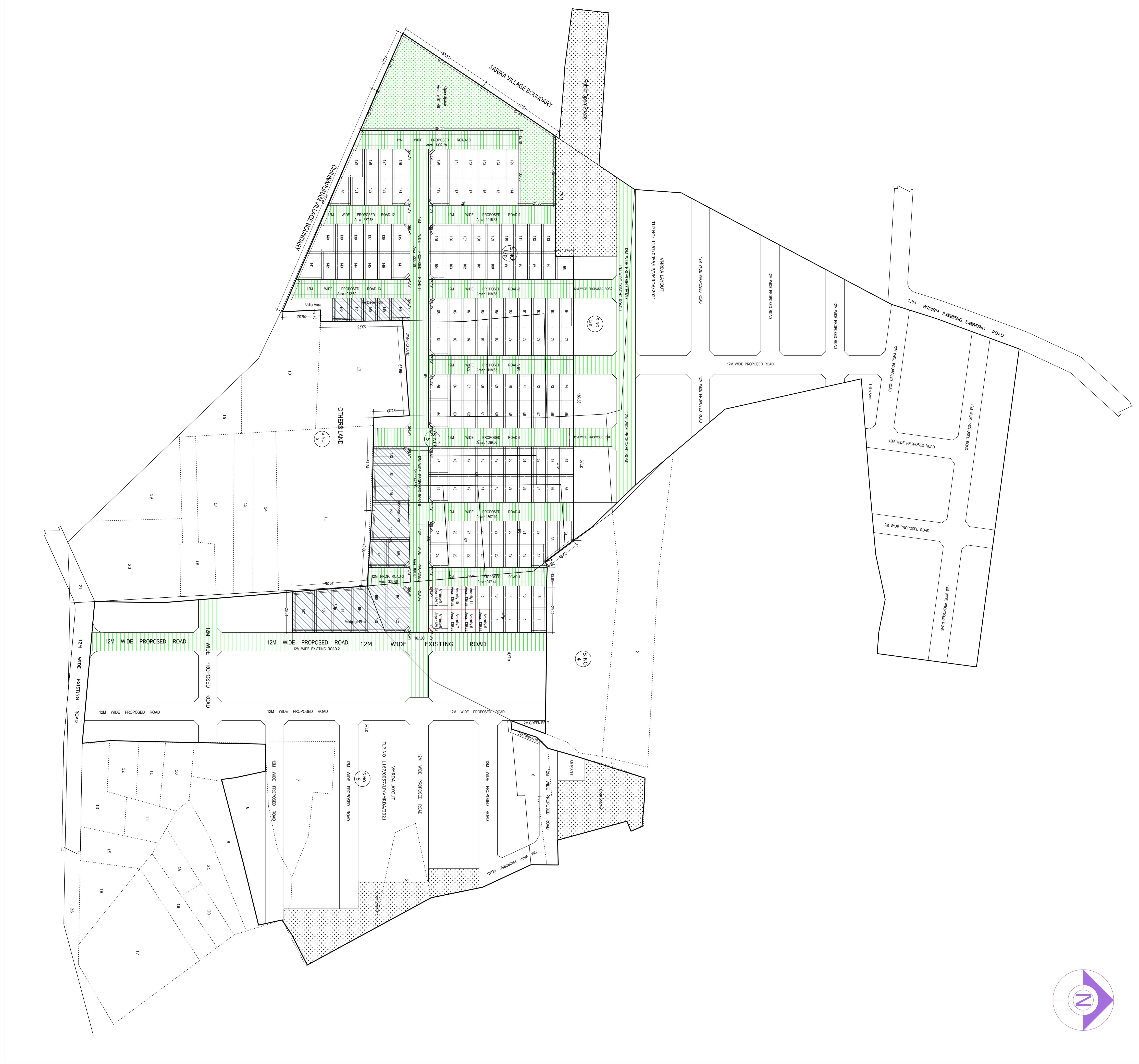
LAYOUT PLAN (Scale - 1:800)