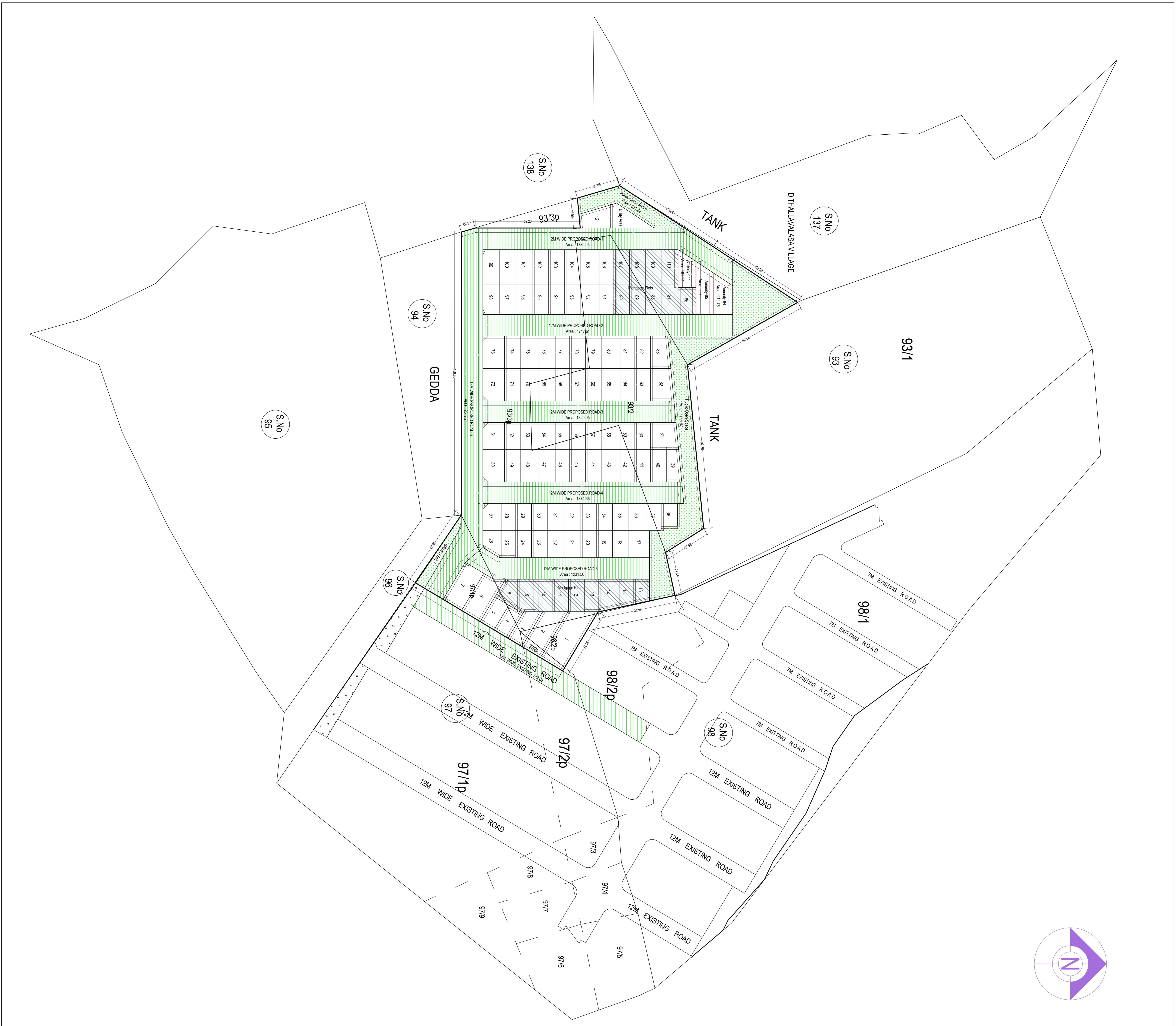
LAYOUT PLAN (Scale = 1:800)